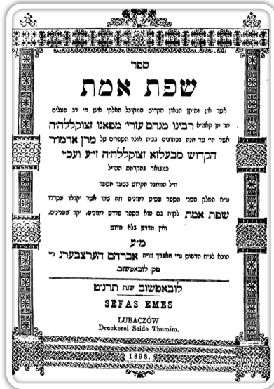
שער ספר שפת אמת להרמ"ע מפאנו