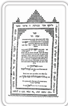
שער ספר צמח דוד

הוא כותב את שאלתו זו בחיבורו על התורה 'צמח דוד' (שאלוניקי תקמ"ה), פרשת וארא דף קלט טו (א). ולימים אנו מוצאים את כ"ק מרן אדמו"ר האמרי אמת זיע"א מצטט את שאלה זו בשמו, תוך כדי שהוא מפליג בשבחו וטובו של הספר, ומוסיף על כך גם תירוץ משלו, וכמובא בספר 'ליקוטי יהודה' (שמות ז יד).