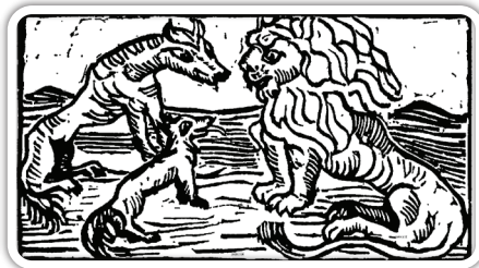
האריה והשועל - תחריט עץ מתוך הספר משלי שועלים