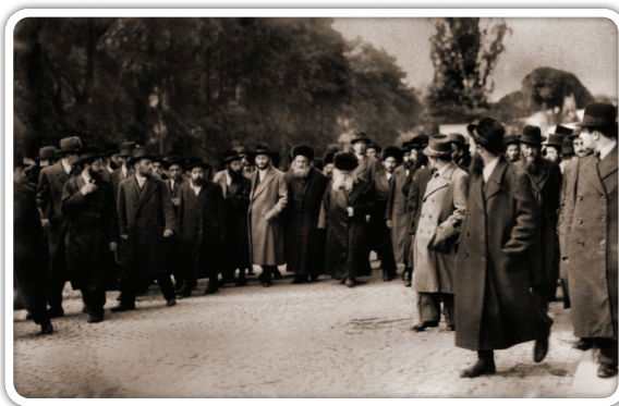
האמרי אמת במרינבד בשנת תרצ"ז