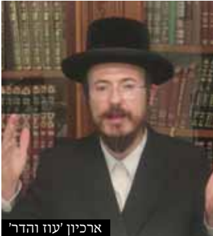
ארכיון 'עוז והדר'

וכשבאו לברר את ההלכה, כבר היה פער ושינוי גדול בין שער הדולר כלפי הפונד [ליש"ט], ועל פי פסק הרבנים דשם, הלואה מותר לו לפרוע רק 188,000 דולר, כך שהמלואה הפסיד 12,000 דולר.