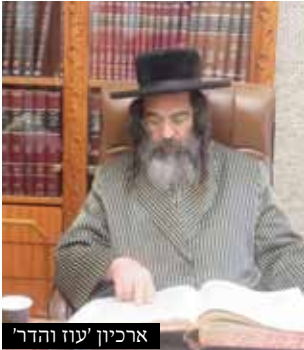
ארכיון 'עוז והדר'

אסור ללתות בין חיטין בין שעורים משום דאין אנו בקיאין בלתיתה ואף דהתם מיירי לענין שימוש בקמח המצות בפסח ואילו בנ"ד היתה השאלה על קמח שרוצה להשתמש בו לאחר הפסח, מכל מקום יש למוכרם לגוי כיון דאין אנו בקיאין בלתיתה אפשר שכבר החמיצו החיטים עוד קודם הפסח, ואף דחש רחוק הוא שהרי הלתיתה של היום אינה כמו הלתיתה של פעם ואפשר שמה שעושים היום אולי אינו נחשב ללתיתה כלל מכל מקום כיון דבזמנינו בטחנות הקמח מפעם לפעם משנים את צורת הלתיתה כידוע, ואפשר שיעשו את הלתיתה באופן שיהיה חשש לחמץ כלשהו, ובפרט אחר שיודעים שמקמח זה לא יאפו מצות לפסח ודאי אין נוהרים בו כיאות שלא יבוא לידי חימוץ, ולכן יש למוכרן לגוי דסו"ס אין אנו בקיאין בלתיתה.