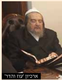
ארכיון 'עוז והדר'

נתאר לעצמנו אם האשה חלילה יושבת ואוכלת כל הערב פסח, והוא רומז לה שצריך לנקות והיא אומרת לו, הרי מדאורייתא בביטול סגי, ופרורים ממילא בטלי, וגם מוכרים לגוי... הרי ברור שכ"א רוצה להאשה תכין את הבית לחג הפסח, אז אדרבה מוכרחים לתת הרגשה טובה בבית. היו הרבה ילדים שלי"ע לא הלכו בדרך שההורים רצו,